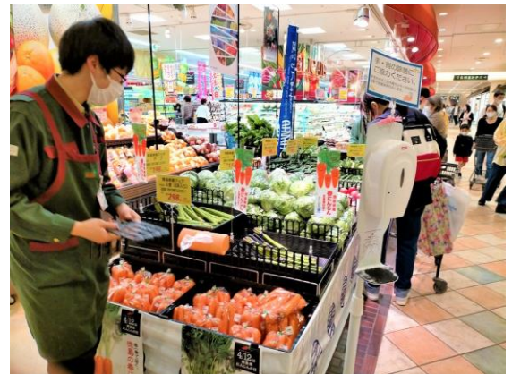
PR販売される旬の「春にんじん」や県産野菜

このフェアでは首都圏の消費者へ県産食材の魅力と価値を発信することを目的として、産地より直送された春にんじんをはじめ、れんこん、ミニトマト、レタス、いちご(さちのか)などの青果物(全11品目)がPR販売されました。各店舗とも家族連れを中心とした買い物客らで賑わい、品物を手にとって、旬の徳島を直接感じていただきました。