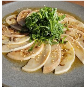
(白ナスのカルパッチョ)

また、同店のマルシェでも「白ナス」のテスト販売が行われ、同JAの産直市である「JA夢市場」から直送された「阿波ベジ」とともにPR販売を行いました。