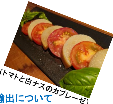
(トマトと白ナスのカプレーゼ)