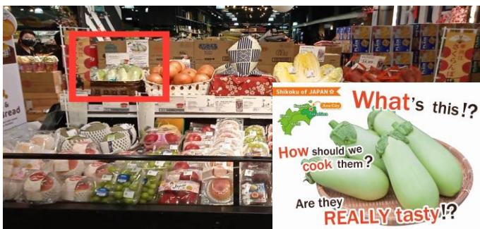
(美～ナス販売の様子)

コロナウイルス感染症により日本への渡航が困難な中、せめて日本の産物を味わいたいという現地でのニーズが高まっているようです。今後も新たな品目の輸出拡大に向けて取組を進めていきます。