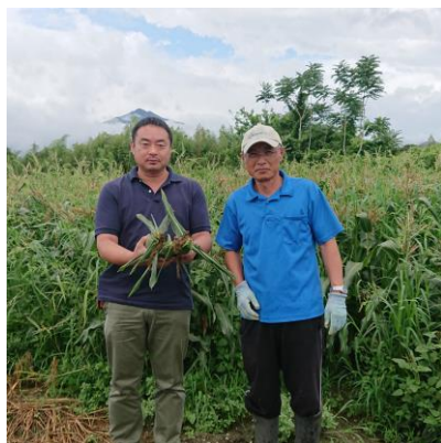
《管内生産者は場でのヒアリング調査》