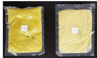
すだちペースト、すだちあん