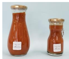
左ユズトマトソース、 右ユコウトマトジュース