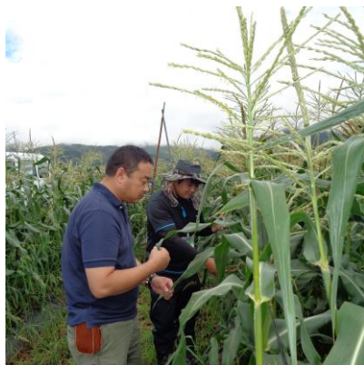
《JA及び機構担当者による生育調査の様子》

出荷については7月下旬頃まで続き、JA全農とくしまを通じて関西のスーパーで販売されています。