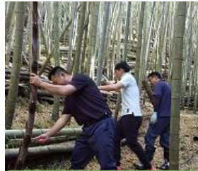
"孟宗竹"の切り出しと皮むき作業

国産メンマについては、全国各地で産地づくりの動きがあるホットなニュースです。先日、JAアグリあなん女性部役員や阿南農業支援センターが試作をしました。今後、JA内での機運の高まりが期待されます。