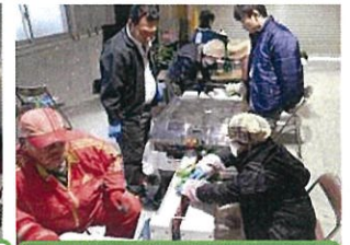
機械による作業実証