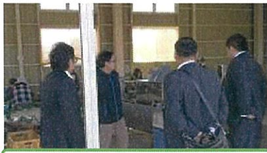
関係者による先進地調査