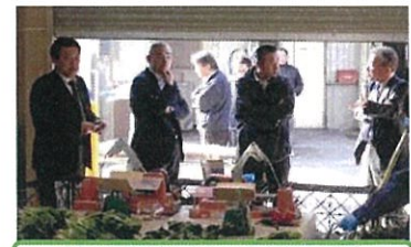
市場関係者の現場見学

○ 今後も関係機関と連携して「産地活性化の提案」に取組ますので、御協力をお願いします！