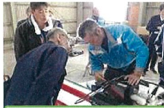
下葉調製機の実証