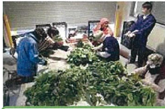
手選別による作業実証

そこで、「露地ほうれんそう」の生産量の回復を目指し、栽培上の課題である調製作業の効率化を図るため共同選別作業化の実証に取り組みました。