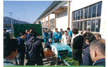
クボタ担当者から説明