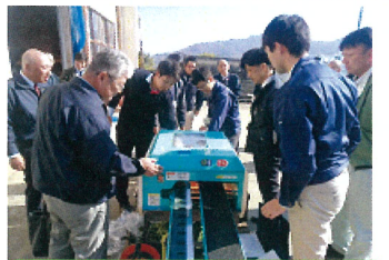
熱心に見学する参加者